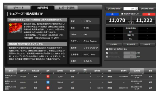
※画面は開発中の画面イメージです。実際の内容とは異なります。

サービスリリース時期が確定しましたら別途詳細をご報告します。 ※リリースは 2016 年度中を予定しております。