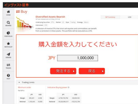
※画面は開発中の画面イメージです。実際の内容とは異なります。

サービスリリース時期が確定しましたら別途詳細をご報告します。 ※リリースは 2016 年春を予定しております。