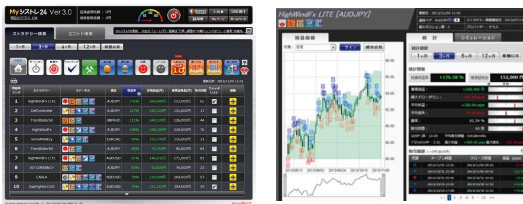
「My シストレ 24」画面イメージ

取引ツール「Mirror Trader」は、その性能の高さから世界中で導入されていますが、3000種類以上のストラテジーから優秀なものを探すことは非常に難しいものでした。2012年7月から提供を開始した「My シストレ 24」は、二度の大幅バージョンアップや細部の機能強化を重ね、初心者でも直感的に的確なストラテジー検索ができるように設計されています。